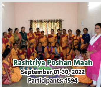
Rashtriya Poshan Maah September 01-30, 2022 Participants: 1594