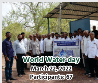
World Water day March 22, 2022 Participants: 67