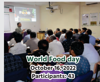
World Food day October 16, 2022 Participants: 43