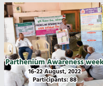
Parthenium Awareness week 16-22 August, 2022 Participants: 88