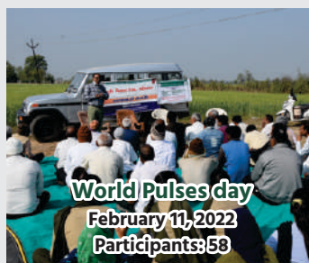
World Pulses day February 11, 2022 Participants: 58