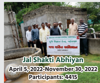
Jal Shakti Abhiyan April 5, 2022-November 30, 2022 Participants: 4415