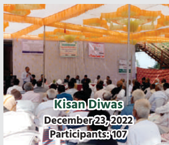
Kisan Diwas December 23, 2022 Participants: 107