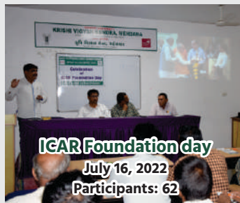
ICAR Foundation day July 16, 2022 Participants: 62