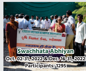
Swachhata/Abhiyan Oct. 02-31, 2022 & Dec. 16-31, 2022 Participants: 1295