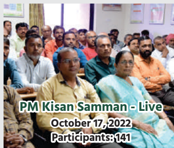
PM Kisan Samman - Live October 17, 2022 Participants: 141