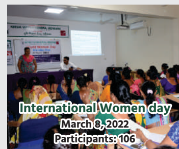
International Women day March 8, 2022 Participants: 106